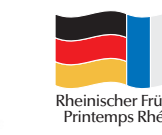
Rheinischer Frühling Printemps Rhénan