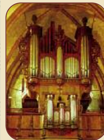
Grandes Orgues Andreas Silbermann (1709)

En partenariat avec la Ville de Marmoutier