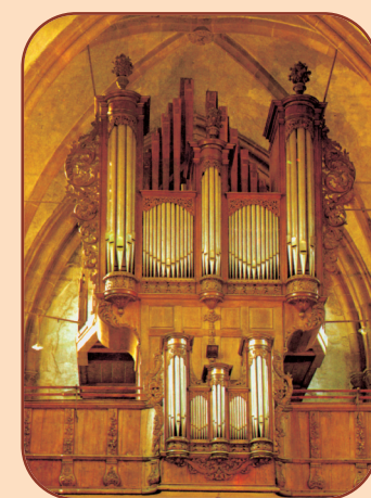
Grand Orgue Andreas Silbermann(1709)

En partenariat avec la Ville de Marmoutier